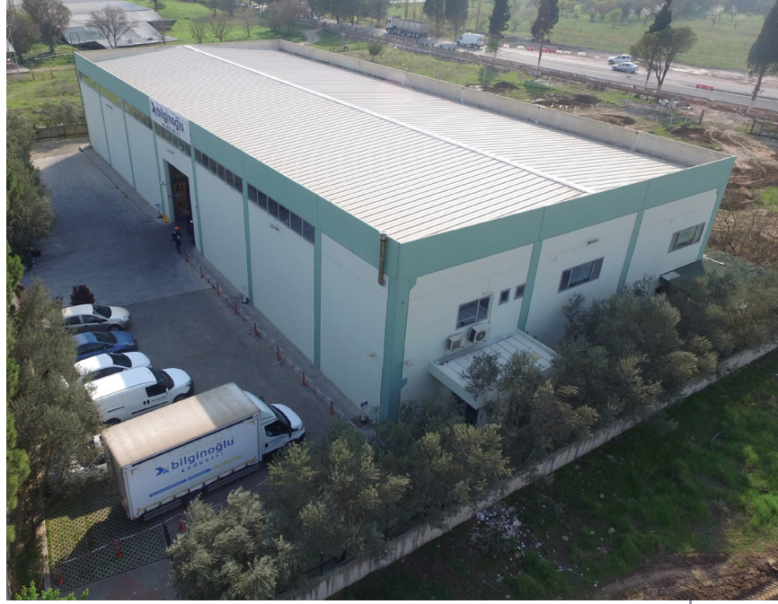
Ulucak Merkez Depo / Ulucak Central Warehouse