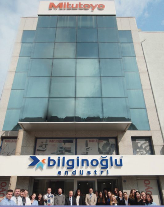
İzmir Merkez / İzmir Area Head Office Working Area; Aegean, Central Anatolia, Eastern Anatolia, Mediterranean and South East Anatolia Region