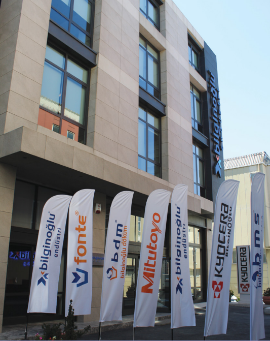
İstanbul Satış Ofisi & Showroom / İstanbul Sales Office & Showroom Working Area; Marmara, Trakya and West Blacksea Region