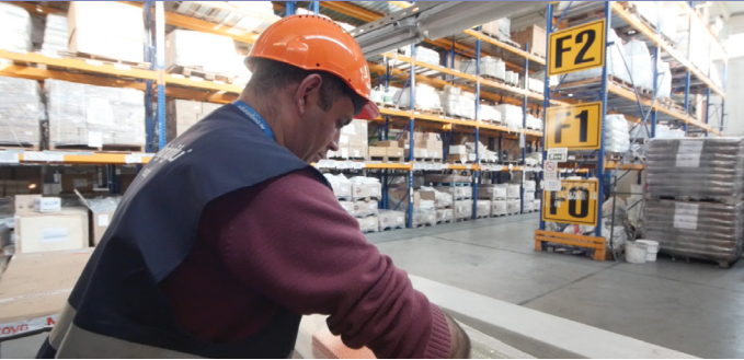
Ulucak Merkez Depo / Ulucak Central Warehouse