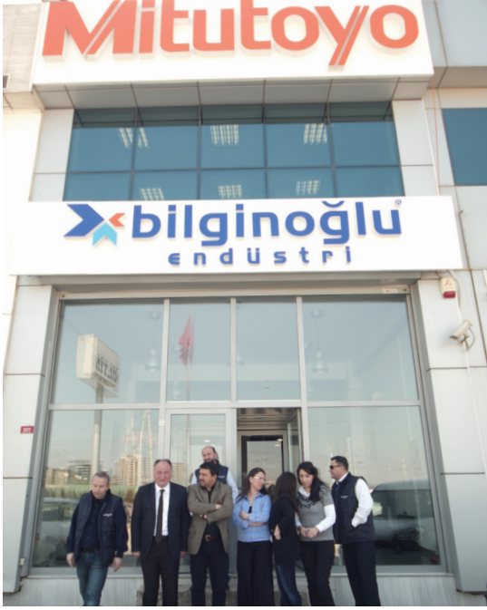
Bursa Satış Ofisi & Showroom / Bursa Sales Office & Showroom Working Area; Bursa, Bilecik and Eskişehir