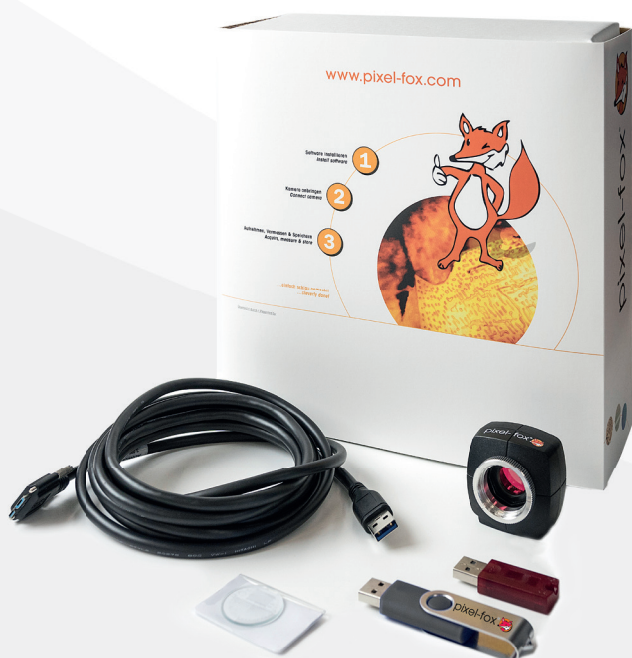
pixel-fox® Basispaket / pixel-fox® Basic package

Thanks to the standardised USB 3.0 interface and the C-mount thread on the camera, pixel-fox® can be mounted on any generally available microscope, macroscope, endoscope, lens (and much more). Whether in industry, LifeScience, quality assurance, laboratories, research & teaching, training etc. – high quality hardware and a variegated, easy to use software provides an optimal representation of your specimens in shortest time.