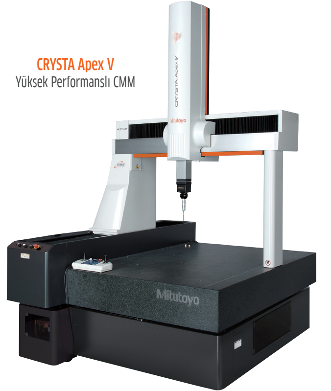
CRYSTA Apex V Yüksek Performanslı CMM