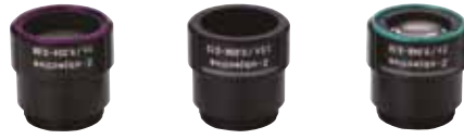
Değiştirilebilir 1X, 1.5X ve 2X lensler