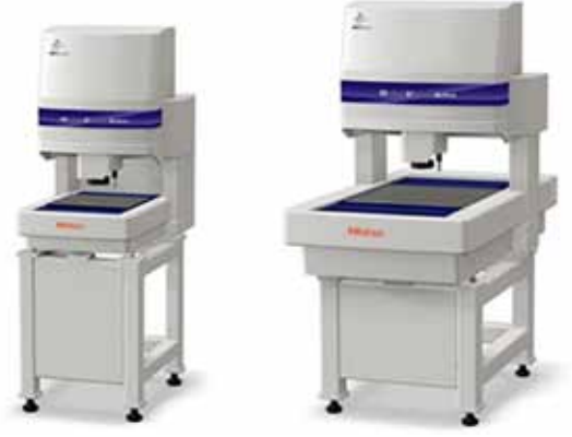
Quick Vision ACTIVE 202 ve 404, Dokunmatik Prob opsiyonu ile birlikte